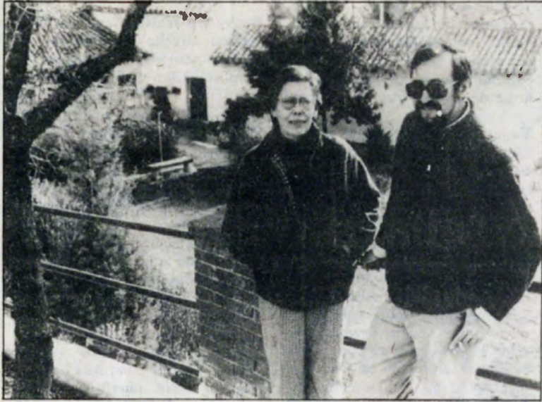
Los dos sociólogos vascos.

«Si cuando Herri Batasuna o el PNV gritan 'Nafarroa Euskadi da' estuvieran —añaden los sociólogos— sólo invocando el recuerdo histórico de la lejana unidad del Ducado de Vasconia del primer milenio, o la cercana del reino de Navarra en los albores del segundo, tal invocación no pasaría de ser una mera afirmación voluntarista y oponerse a ella sería una mera cuestión de propaganda. Pero —siguen diciendo— lo que convierte ese grito en un problema material para los que decidan oponerse a él, es el hecho de que, precisamente bajo el régimen de